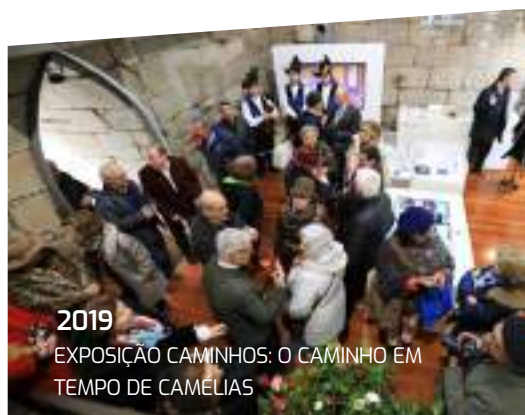
2019 EXPOSIÇÃO CAMINHOS: O CAMINHO EM TEMPO DE CAMÉLIAS