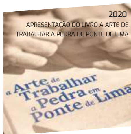
2020 APRESENTAÇÃO DO LIVRO A ARTE DE TRABALHAR A PEDRA DE PONTE DE LIMA