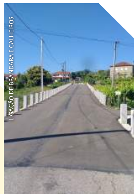
LIGAÇÃO DE BRANDARA E CALHEIROS