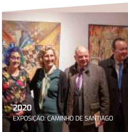
2020 EXPOSIÇÃO: CAMINHO DE SANTIAGO