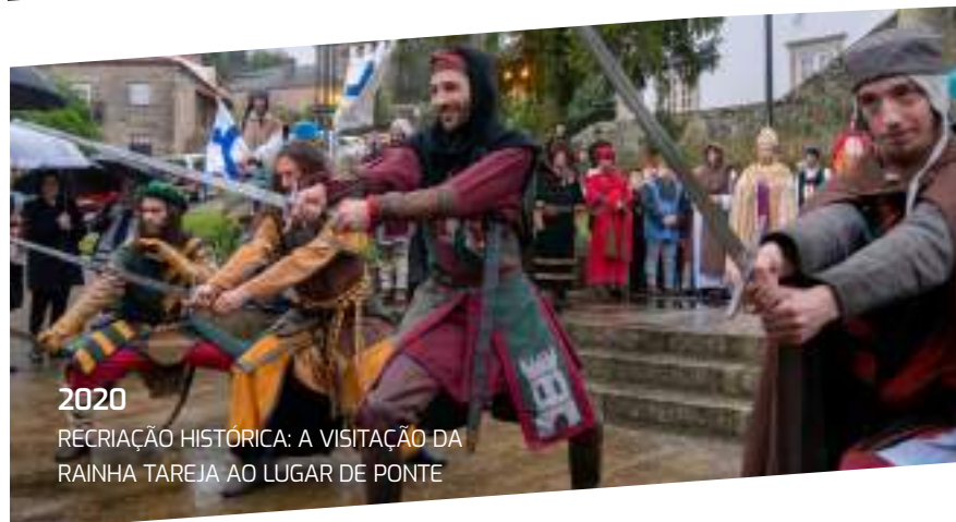
2020 REcriação HISTÓRICA: A VISITAÇÃO DA RAINHA TAREJA AO LUGAR DE PONTE